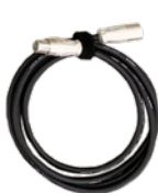
① キャノン 4pin-3pin パワーケーブル