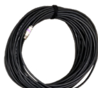
② キャノン 3pin パワーケーブル 30m