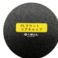
PL マウントリアキャップ