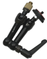
NOGA アーム (S) 小 - 大変換付