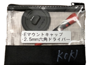
E マウントキャップ 2.5mm 六角ドライバー