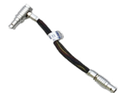
Lemo 5pin D-BOX 接続ケーブル