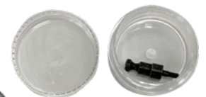
フォーカスフック