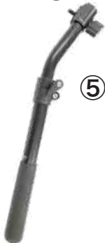
⑤ パン棒 (短)