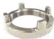
② ロックリング ③ φ150 ボール