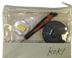
E マウントキャップ 2.5mm 六角ドライバー マウントネジケース