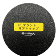
PL マウントリアキャップ