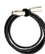
キャンノン 4pin-3pin パワーケーブル