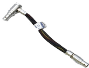
Lemo 5pin D-BOX 接続ケーブル