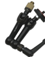
NOGA アーム (S) 小 - 大変換付