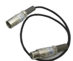
キャンノン 5pin-3pin ケーブル