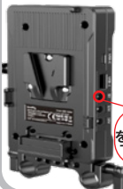
④ V マウント アダプタープレート (φ15 ロッドコンソール付)