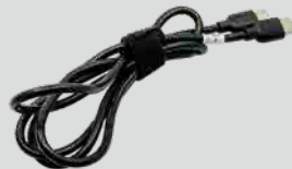
USB TypeC ケーブル (チャージャー用)