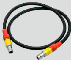
Lemo2pin ケーブル 0.5m