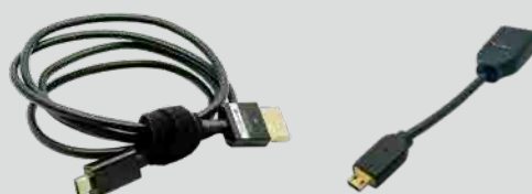
HDMI-micro HDMI ケーブル HDMI-micro HDMI 変換