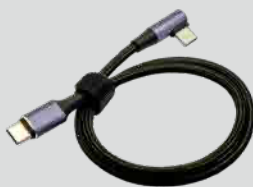
USB ケーブル L 字 (給電用)